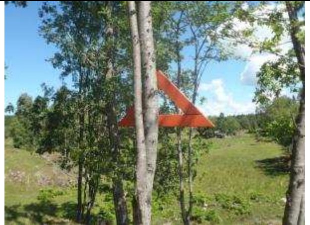
Orangea trätrianglar visar vägen genom en av hagarna.