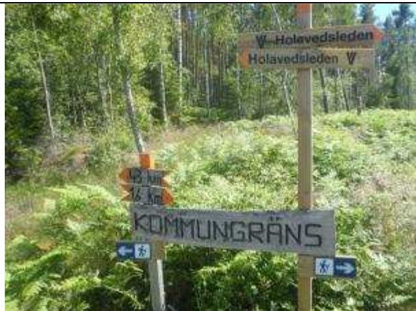
Avståndsmarkeringarna stämmer inte för tävlingen...