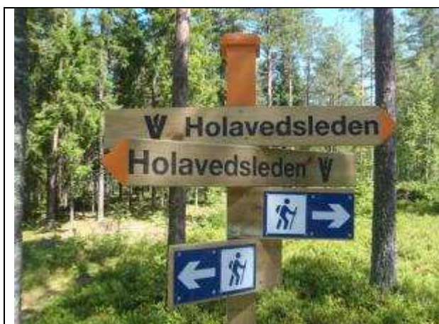
Skyltar i blått och vitt. Pilar och stolpar med orange färg.