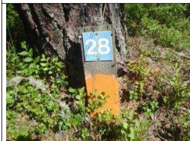
Markering i orange med siffra för sevärighet.