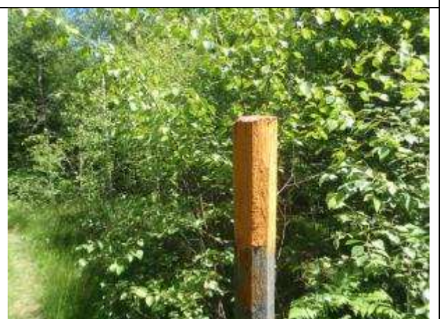
Orange markering på stolpe.