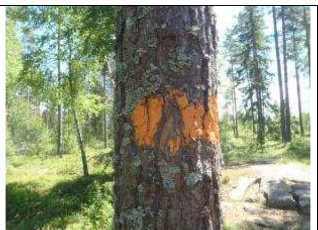
Orange färg på träd.