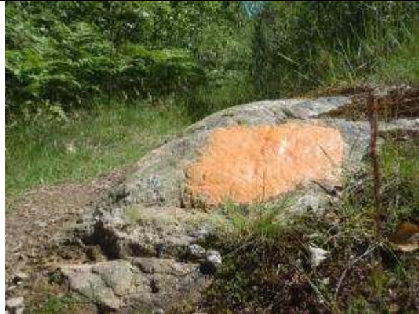
Orange markering på sten.