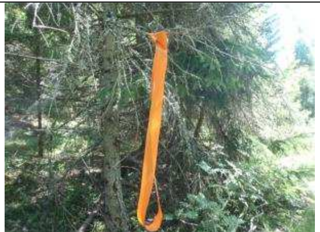
Vi har förstärkt befintliga markeringar med orange snitslar. Kan förekomma någon enstaka röd.